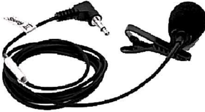
ميكرفون مشبك يوضع في الكاميرا أو الموبايل المحمول

وهو ميكرفون صغير الحجم يوضع على صدر المتحدث ويكاد يظهر في اللقطة لكنه حساس للرياح والضجة وحركة الجسد.