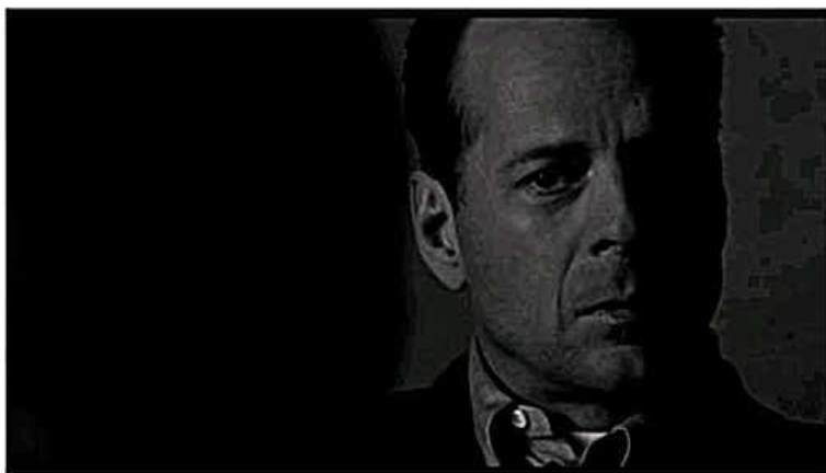
Close Up C/U

اللقطة القريبة، وهي بنسبة للإنسان تمثل الرأس أو الوجه أو إلى الكتفين.