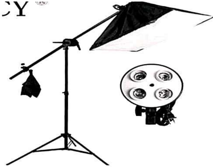
شكل يوضح بعض اجهزة الاضاءة في استديو صغير

يعد مصدر الضوء من أهم عناصر التصوير الاحترافي باستخدام الكاميرا، وينبغي عليك أن تدرس وتتعلم كيفية استخدام الإضاءة بأنواعها، إذا كنت ترغب في تعلم التصوير الفوتوغرافي؛ ويُعرف التصوير بأنه فن الرسم بالضوء لذا فإنه لا تصوير بدون إضاءة (26) .