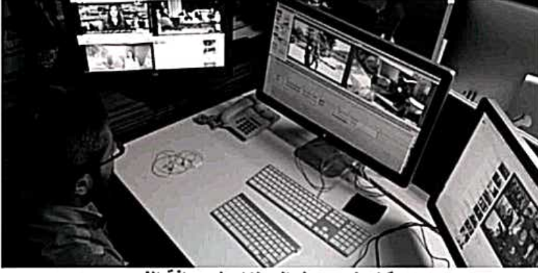
صورة توضح عمل المونتاج لصحافة الفيديو

وهذه المرحلة مهمة للغاية تتم بعد انتهاء صحفي الفيديو من تصوير القصة الصحفية الخاصة به على هيئة لقطات متعددة تأتي المرحلة الأخيرة والخاتمة لهذا العمل وهي مرحلة المونتاج.