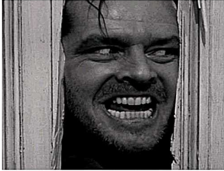
Extreme Close Up ECU

لقطة قريبة جدًا، وتختلف عن اللقطة السابقة في التركيز على جزء محدد من الوجه أو العنصر أو الموضوع مثل خاتم في الإصبع، أو العين وخلافه.