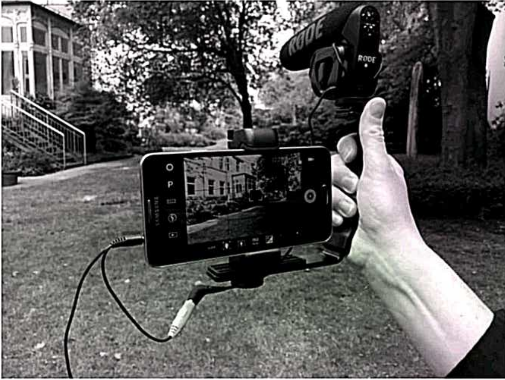
صورة لصحافة الموبايل

وتعد صحافة الموبايل من الأنماط الصحفية الأكثر تفاعلا من قبل الجمهور، ومشاركة للأفكار والرؤى، بمعنى آخر إنها صحافة الوسائط المتعددة التي تتواجد على مختلف المنصات الإلكترونية من شبكات إجتماعية وتطبيقات اتصالية وبرامج تواصلية، إنها ثورة اتصالية دمجت بين جملة من التطبيقات والمنصات بهدف محاصرة المستخدم بكثير من الوظائف والإمكانات التفاعلية الفريدة من نوعها (11) .