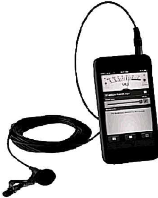
مايك ملحق بالموبايل او المحمول اثناء تصوير

هو العامل الثاني بعد الكاميرا وغالبًا يعد موضوع ضبط الصوت من الموضوعات الصعبة التي تواجه صحفي الفيديو الأمر الذي يجعله يلجأ غالبًا إلى استخدام ميكروفون متصل بالكاميرا الخاصة به، حيث أصبحت التقنيات الحديثة تسمح بإنتاج تسجيلات رقمية ذات جودة احترافية علي الحاسب الآلي أو جهازك الشخصي اللاب توب دون تكلفة. إضافة إلى إنتاج برامج لتنقية الصوت متاحة على الإنترنت مثل برنامج "جولد ويف" وهو برنامج رقمي احترافي لتسجيل الاصوات وتحريرها من الشوائب والتأثيرات الاخري عليها (14) .