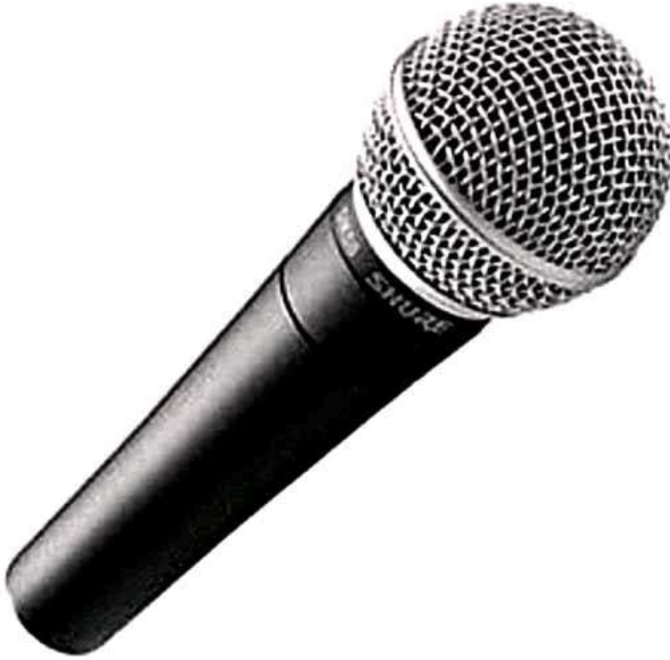
صورة لميكروفون عادي يدوي

وهو الميكرفون العادي الذي يحمل باليد ويكون قريب من مصدر الصوت ومن فمه ويظهر دائماً في اللقطة، وهو من الميكروفونات القوية ويستطيع مقاومة الهواء الشديد والرياح والازدحام والضجة ومناسب للعمل الميداني وتجميع الآراء حول قضية ما كاستفتاءات علي التعديلات الدستورية او الانتخابات العامة... إلخ.