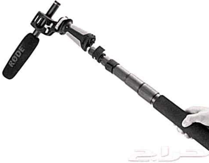
ميكروفون مصوب و ملحق به عصا

وهو ما يوضع علي ذراع طويل ليبقي خارج مكان التصوير، وهو ميكرفون يلتقط الصوت من جهة واحدة فقط وهو افضل بكثير للاستعمال في الهواء الطلق عند وجود الرياح (7) .