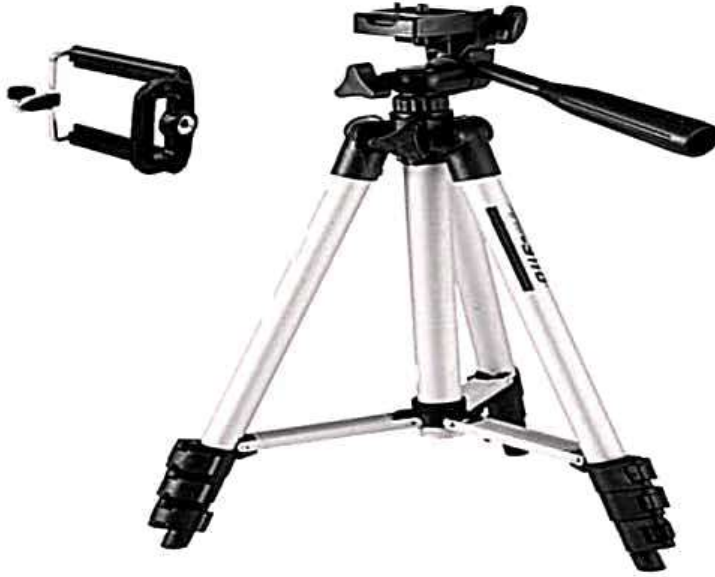
حامل لكاميرا التصوير

تعتبر حاملات الكاميرا من الأدوات الرئيسية اللازمة لعملية تصوير صحافة الفيديو ويعمل حامل الكاميرا على تثبيت الكاميرا على لقطة معينة دون حدوث أي حركة تشوش على الصورة اثناء التصوير خاصة في اللقاءات الطويلة كتصوير ندوة أو مؤتمر، حيث يكون من الصعب حمل الكاميرا بواسطة عنصر بشري لفترة طويلة قد تمتد إلى ساعة أو أكثر دون حدوث أي اهتزاز أو حركة بالصورة مما يؤثر على جودة التصوير.