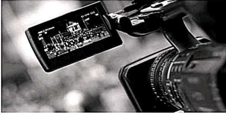
صورة توضح حجم اللقطات في صحافة الفيديو

كل لقطة تضع نفسها في منظور معين. على سبيل المثال، لقطة واسعة تظهر قماشاً بأكمله حيث يأخذ التسلسل دوره يمكنك من إنشاء الإعداد الخاص بك وتقديم السياق البصري. يمكن أن يساعد عن قرب على تضخيم مشاعر محددة، على سبيل المثال، لقطة عن قرب لتصبب العرق من أسفل جبهة سارق يمكن أن يزيد من توتر مشهد سرقة بنك.