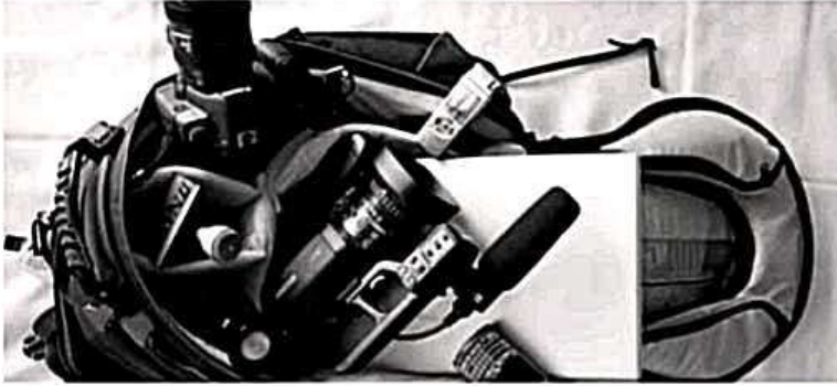
أدوات تصوير صحافة الفيديو

بالرغم من قلة أهميتها بالنسبة لعملية التصوير ويمكن الاستغناء عنها بعكس الكاميرا والميكرفون إلا إنها تتنوع بين الحوامل الثابتة وتستخدم للتصوير الخارجي واهمها الحامل الثلاث الارجل وهو اكثر انواع الحوامل انتشار خاصة مع صحفيي الفيديو لسهولة حمله والحوامل المتحركة المزودة بعجلات تتحرك في مختلف الاتجاهات والأماكن والأوقات (8) .