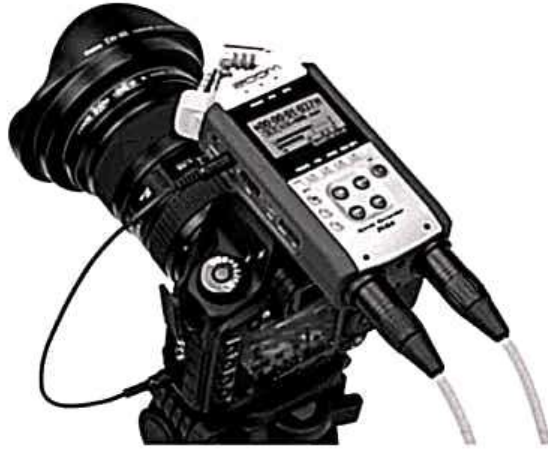
ميكروفون لاسلكي ملحق بكاميرا تصوير

لذلك لابد لصحفي الفيديو عليه أن يختار الميكروفونات المناسبة للظروف المحيطة بمكان التصوير بالإضافة إلى أنه يمكن أن يستخدم أكثر من ميكروفونات مختلف في تغطية الحدث الواحد.