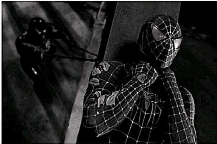
Medium Close Up MCU

اللقطة القريبة، وهي بنسبة للإنسان تمثل الرأس أو الوجه أو إلى الكتفين.